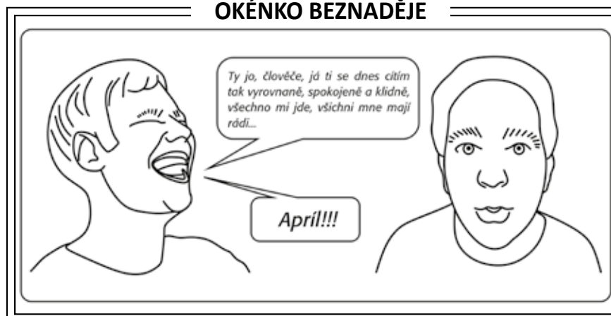
ilustrace: Josef Marek