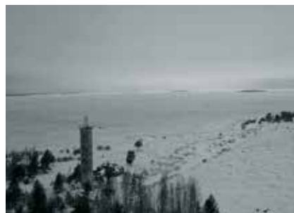
Střední Pohjanmaa, pobřeží Botnického zálivu

R ubrika Zprávy z cest je tu již potřetí! Minulé číslo Ledovek přineslo zprávu o projektu TEACH2HEAL Vyšší odborné zdravotní a sociální školy HIVSET v belgickém Turnhoutu. První setkání tohoto tříletého projektu se uskutečnilo ve finském přístavním městě Kokkola třetí březnový týden.